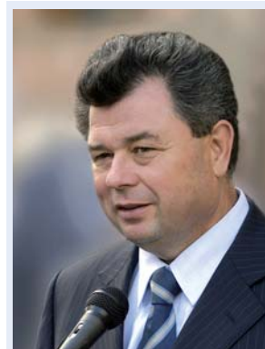
Anatoli Artamonow Gouverneur des Gebietes Kaluga

> Ein Beispiel dafür, wie das Gebiet Kaluga an die Realisierung der Investitionspolitik herangeht, ist die Erschließung eines 50 ha großen kommunalen Gewerbegebiets in der Stadt Obninsk im Jahr 2002. Das Gebiet